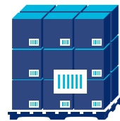
GS1-128 Données "Concaténées"